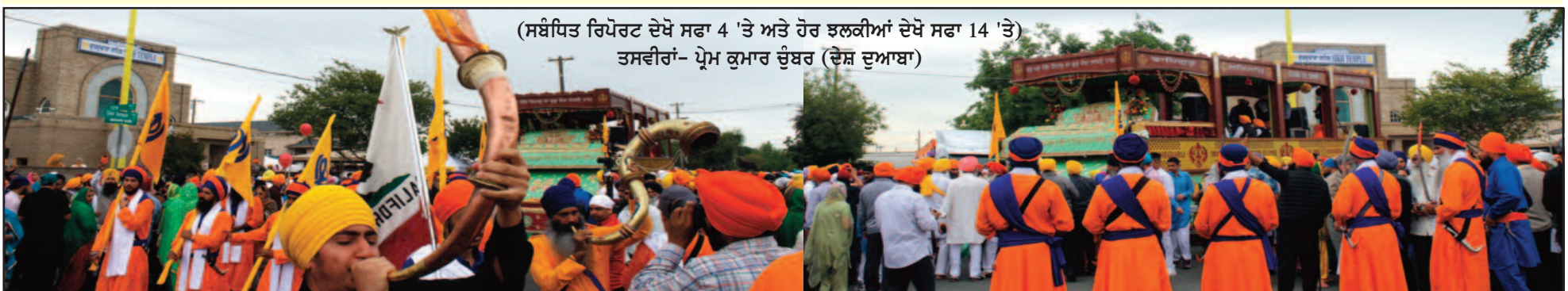
(ਸਬੰਧਿਤ ਰਿਪੋਰਟ ਦੇਖੋ ਸਫਾ 4 'ਤੇ ਅਤੇ ਹੋਰ ਝਲਕੀਆਂ ਦੇਖੋ ਸਫਾ 14 'ਤੇ)

ਗਦਰੀ ਬਾਬਿਆਂ ਦੇ ਇਤਿਹਾਸਕ ਸਥਾਨ ਸਟਾਕਟਨ, ਕੈਲੀਫੋਰਨੀਆ ਗੁਰਦੁਆਰਾ ਸਾਹਿਬ ਵੱਲੋਂ ਵਿਸਾਖੀ ਪੁਰਬ 'ਤੇ ਵਿਸ਼ਾਲ ਨਗਰ ਕੀਰਤਨ ਦਾ ਆਯੋਜਨ ਕੀਤਾ ਗਿਆ, ਜਿਸ ਦੌਰਾਨ ਭਾਰੀ ਮੀਂਹ ਦੇ ਬਾਵਜੂਦ ਹਜ਼ਾਰਾਂ ਸੰਗਤਾਂ ਨੇ ਸ਼ਮੂਲੀਅਤ ਕੀਤੀ।